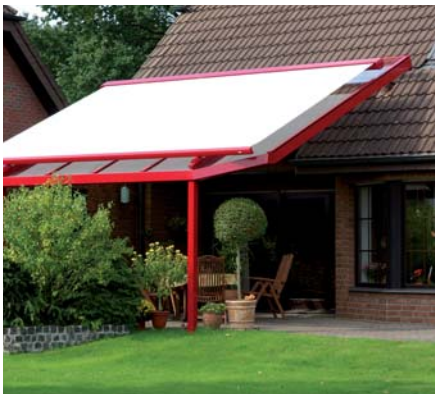
PERGOLY A ZIMNÍ ZAHRADY