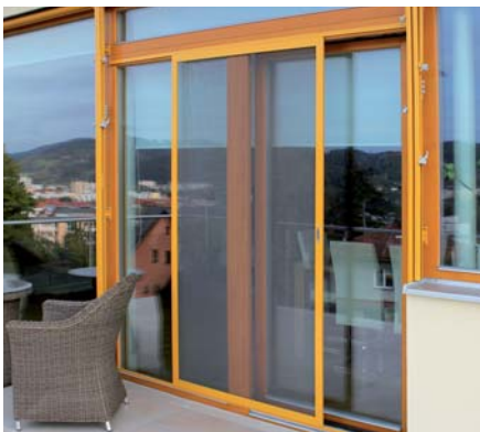
SÍŤ PROTI HMYZU