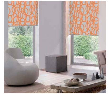
VNITŘNÍ LÁTKOVÉ STÍNĚNÍ