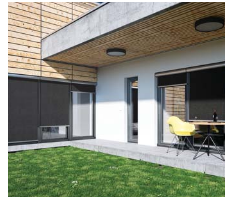
SVISLÉ FASÁDNÍ CLONY